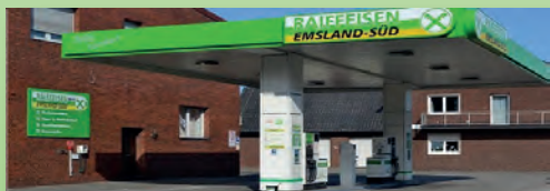
Tankstelle am Standort Leschede

Uneingeschränkte Mobilität zu attraktiven Konditionen: Das ist gerade für die ländliche Region unabdingbar und dank unserer Tankstellen auch möglich. An unseren Tankstellen können Sie 24 Stunden an 365 Tagen im Jahr tanken. Dank moderner Terminals haben Sie die Möglichkeit, sowohl mit Bargeld als auch bargeldlos mit Kredit- und EC-Karte sowie mit unserer Raiffeisen-Card zu zahlen.