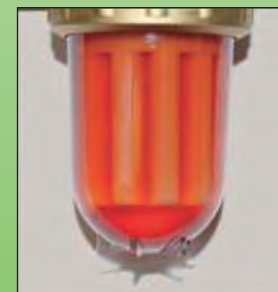
Raiffeisen Spar-Heizöl im gealterten Zustand (ca. 1 Jahr)