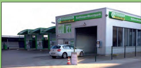
Der neue Waschpark am Standort Freren

Abgerundet wird unser Service durch eine moderne Autowaschanlage in Leschede sowie den neuen Waschpark in Freren. Dort stehen Ihnen auch Hochdruckreiniger, Staubsauger und weitere Pflegegeräte zur Verfügung.